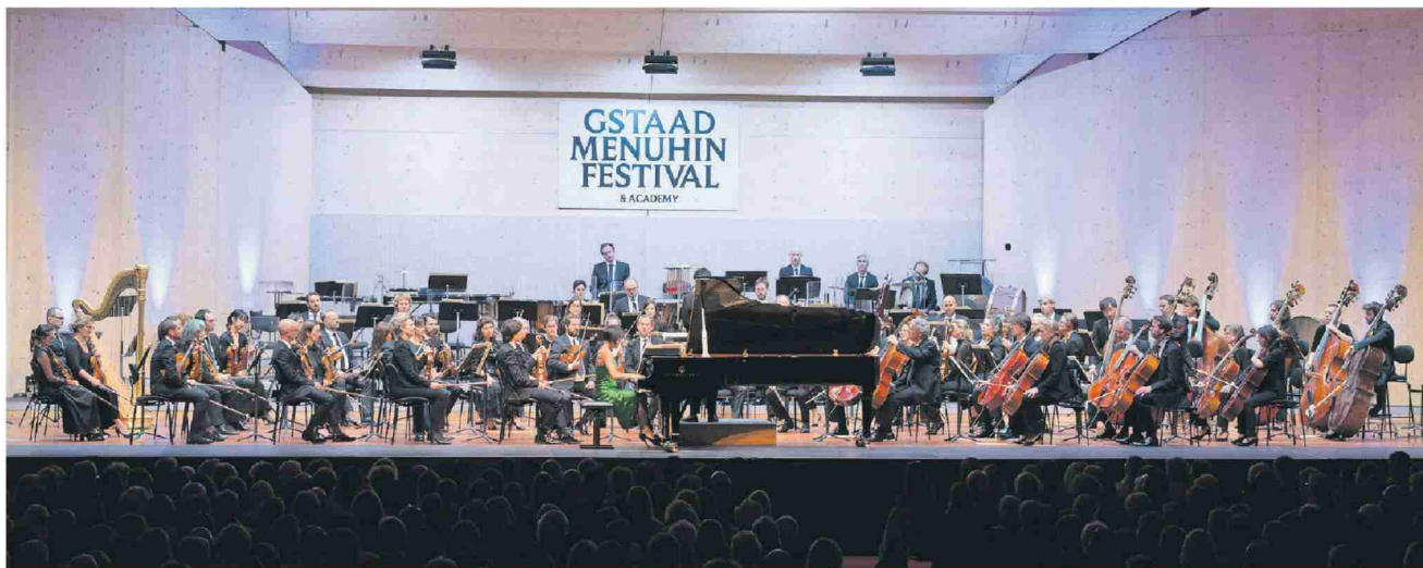
Die 67. Ausgabe des Gstaad Menuhin Festival &amp; Academy endete am Samstag mit dem Konzert des Weltstars Yuja Wang.